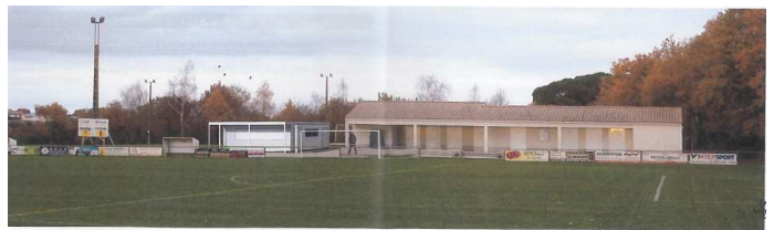
Déplacement bar du terrain de football