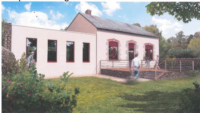
Arrière de la médiathèque

Les plans de l'agrandissement sont arrêtés.